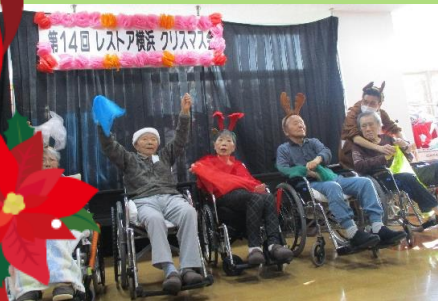
フロアの出し物の様子

12月5日、レストア横浜でクリスマス会が開催されました。 今年は、ハンドベル演奏・各フロアから演奏・二人羽織り等を行いました。 ハンドベルの素敵な音色にみなさん耳を傾けていました。