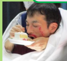
二人羽織りしてます